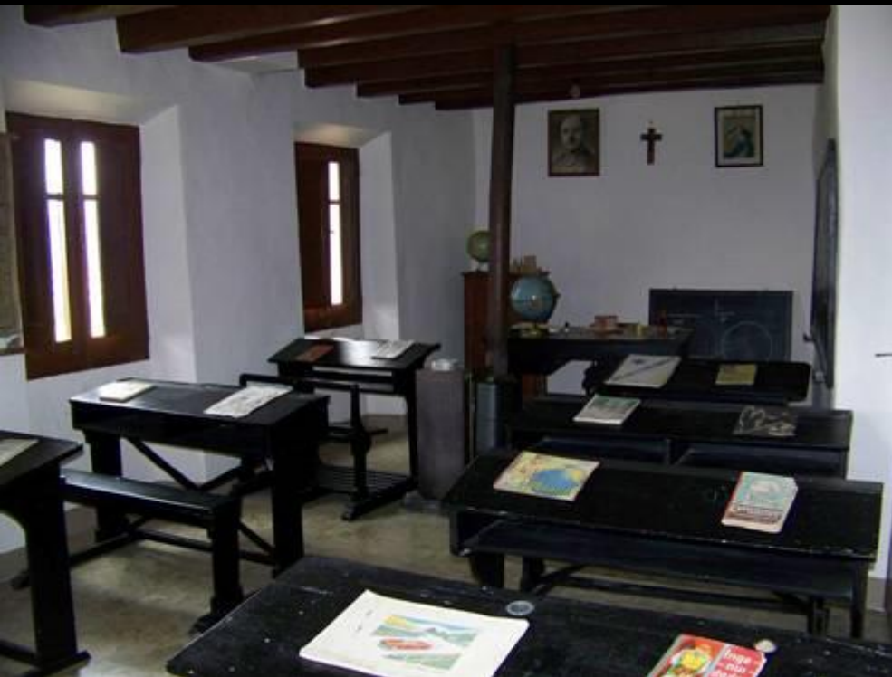
Ancienne école de Sant pere de Castellar