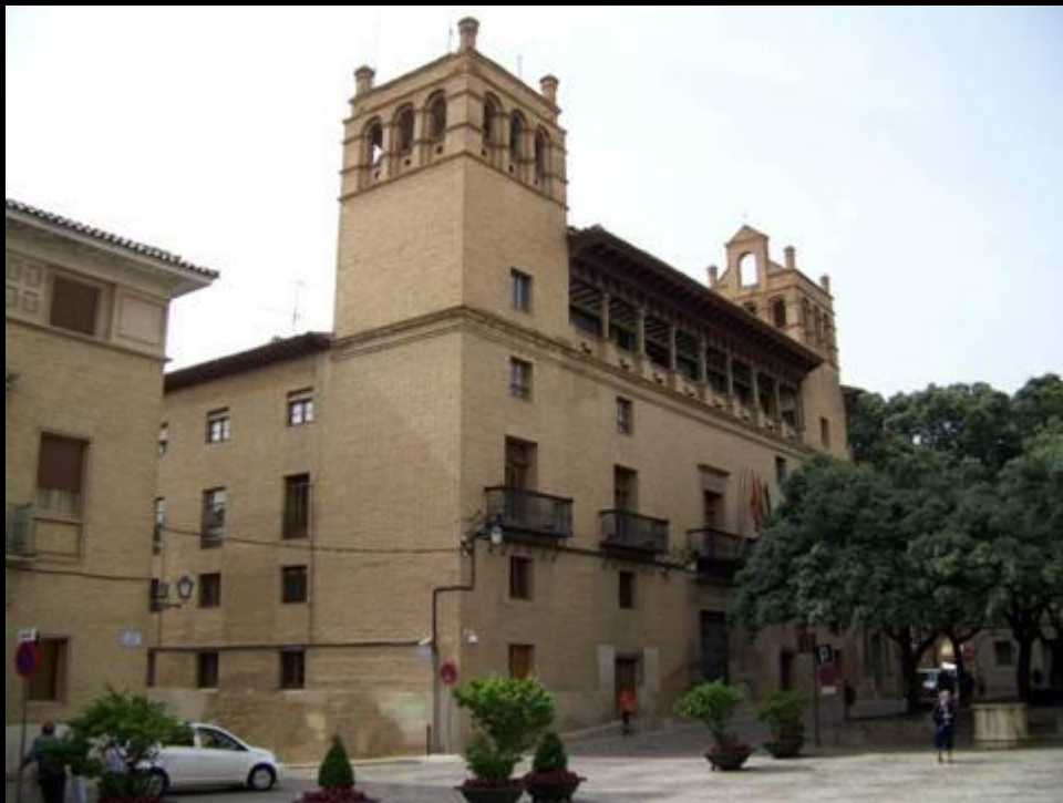
Mairie de Huesca