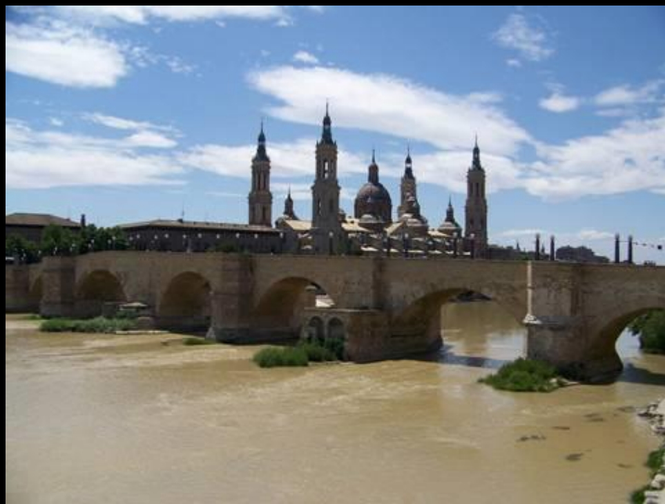
El Puente de Piedra y la basílica