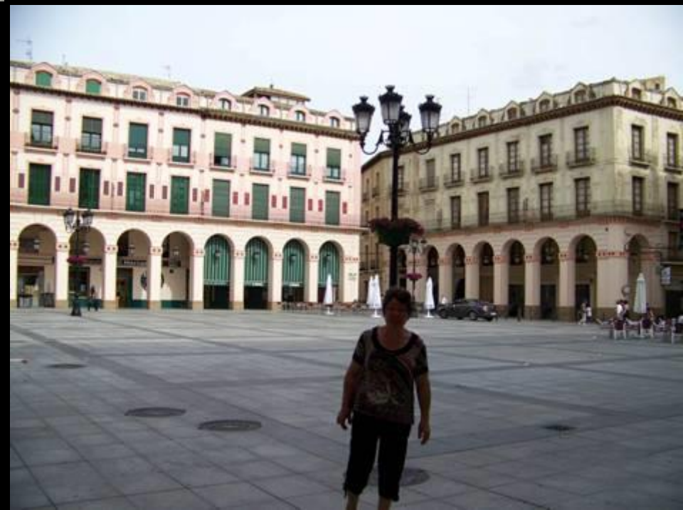
Huesca Plaza de Lopez Allue