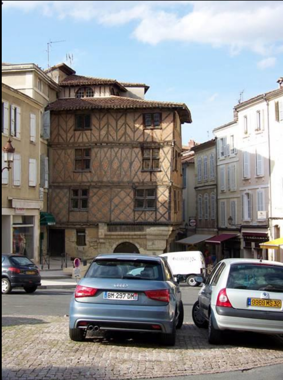
Une maison d'Auch