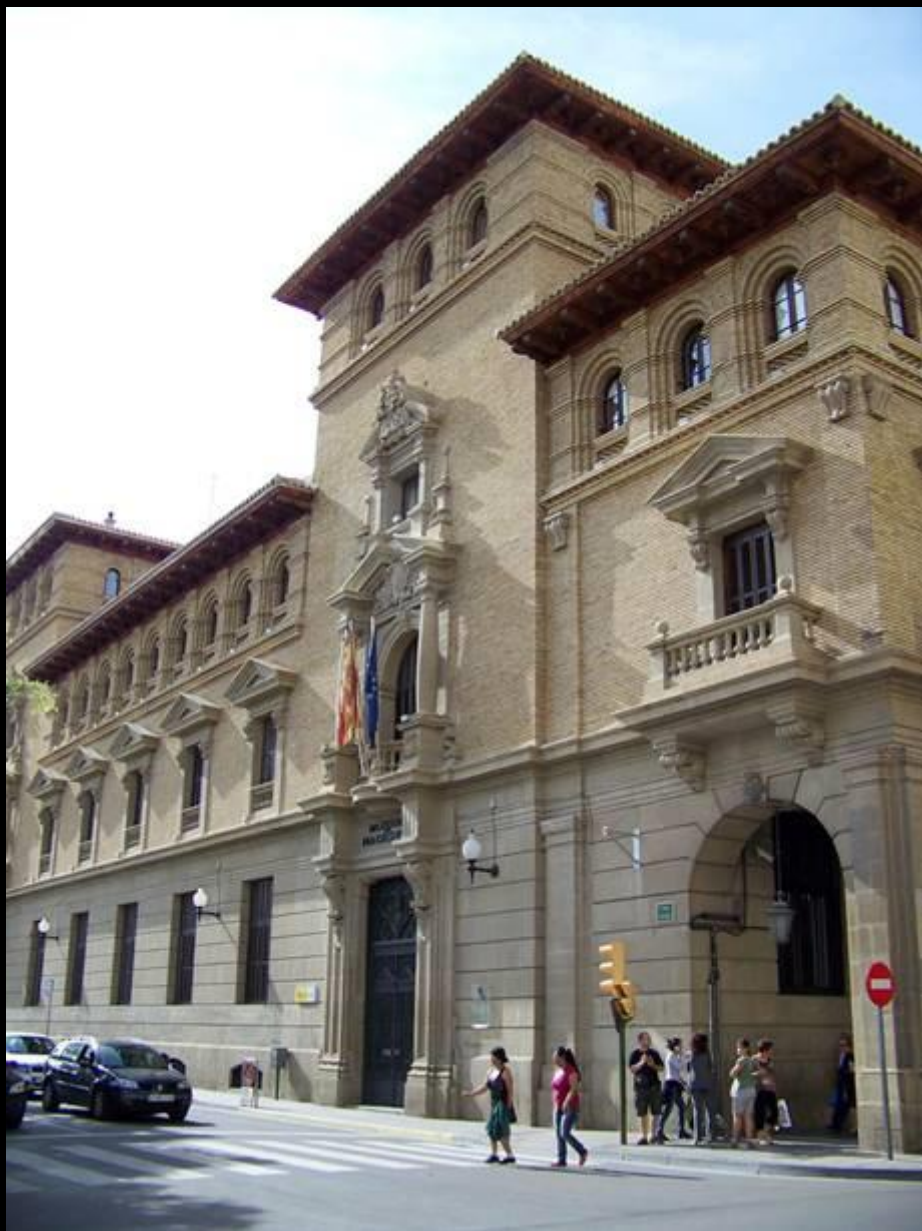
Un bâtiment administratif de Huesca