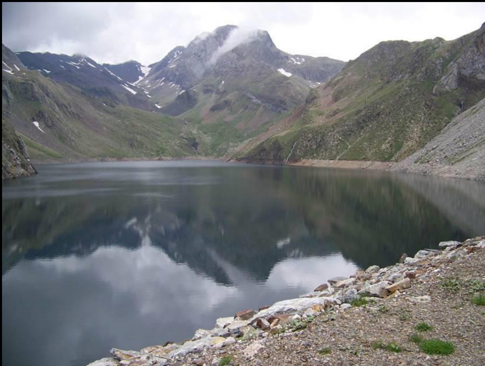
Estany de Llauset (massif de la Maladeta)