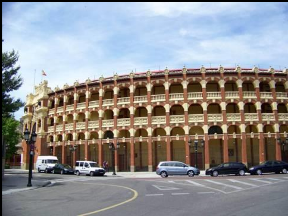
La Plaza de Toros