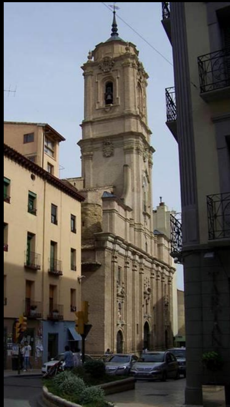
Iglesia San Lorenzo (Huesca)