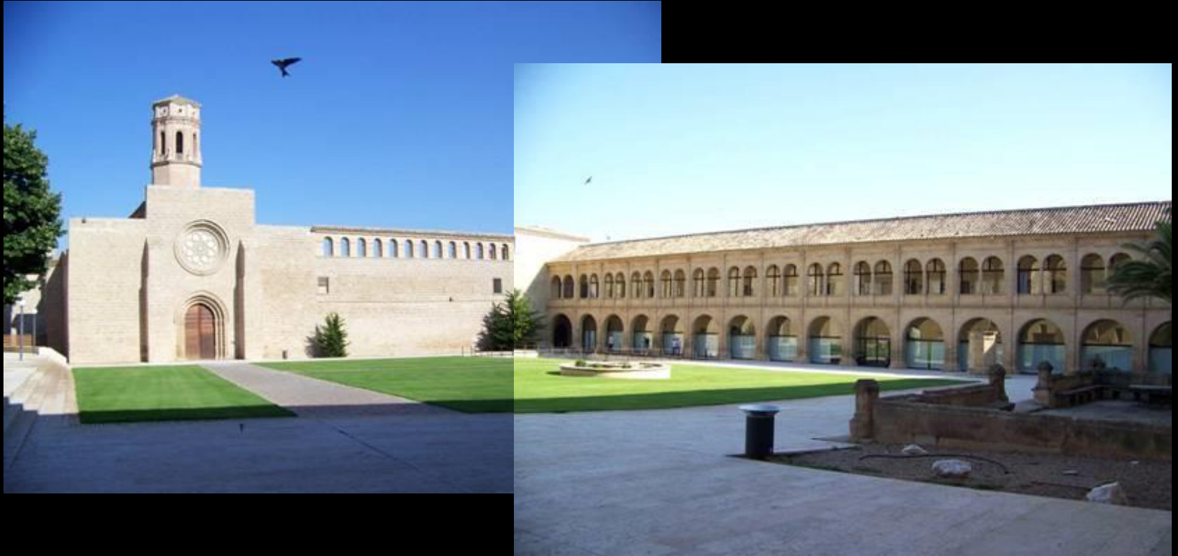
Sur le trajet du retour vers Solsona en passant par la vallée de l'Ebre Monasterio de Rueda