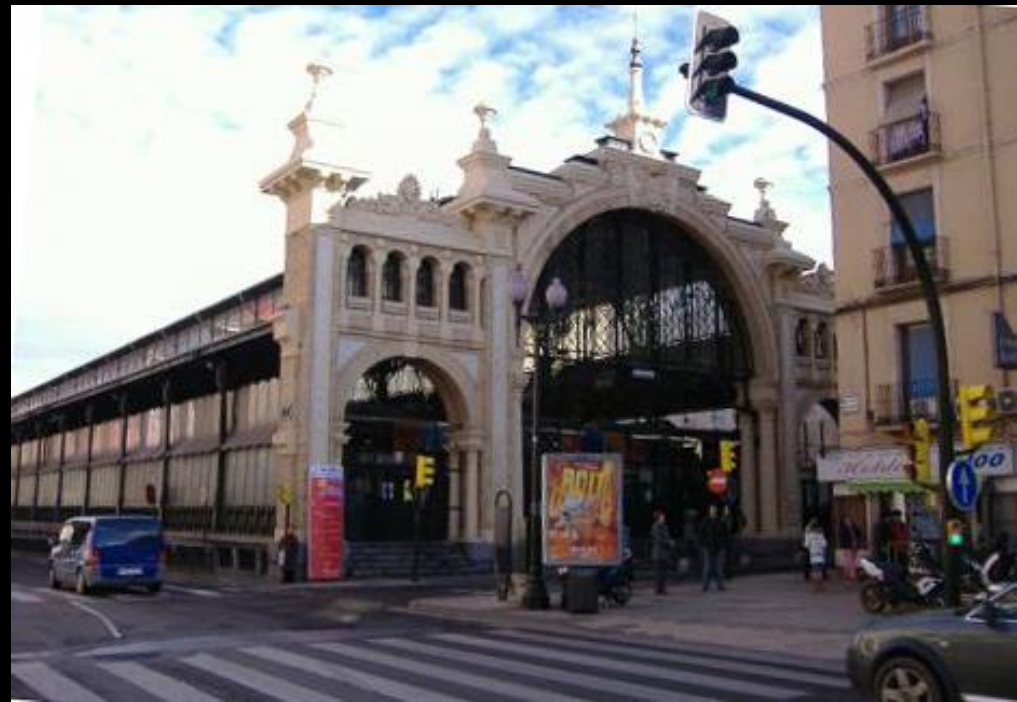
El Mercado central