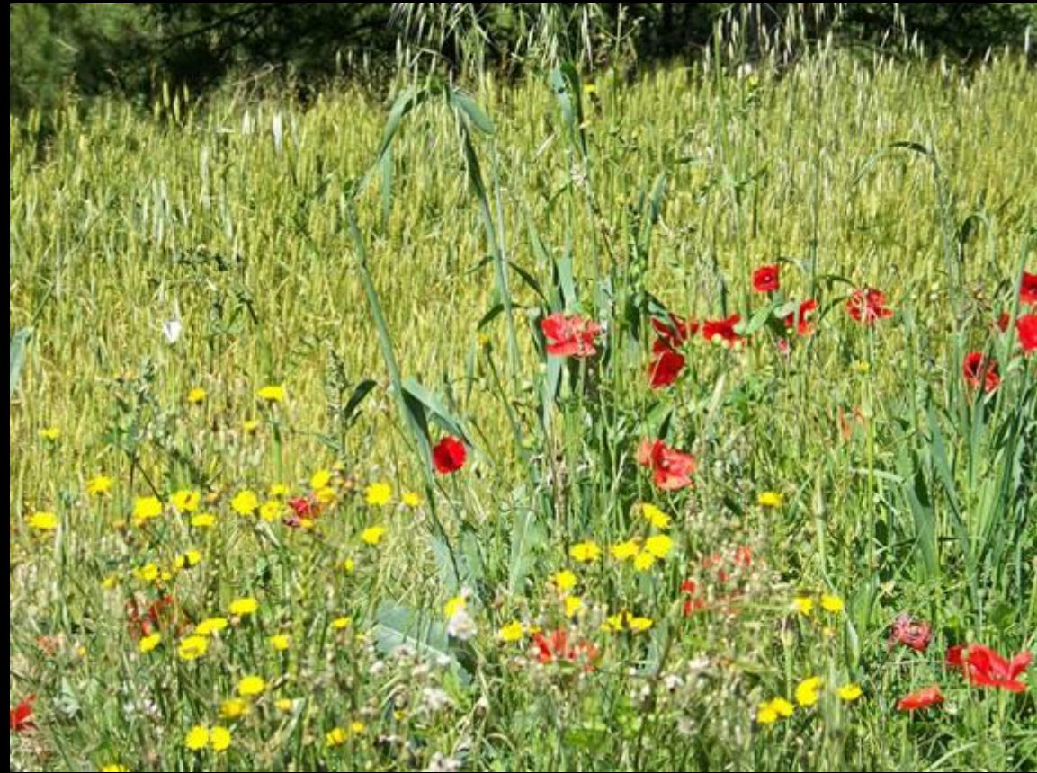
Fleurs des champs du Solsones