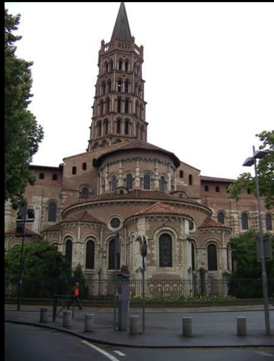
Basilique St Sernin