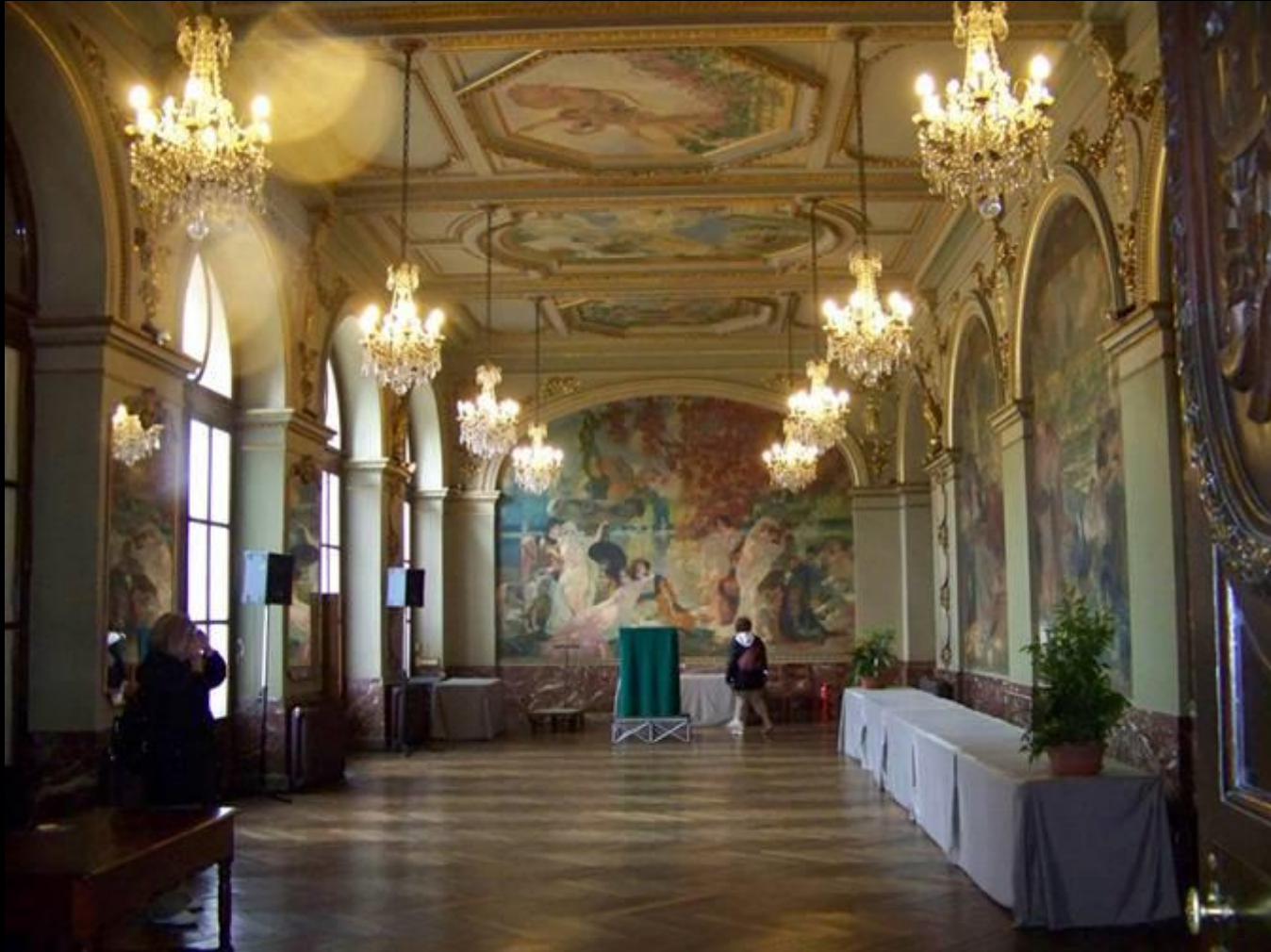
Une des « modestes » pièces du Capitole