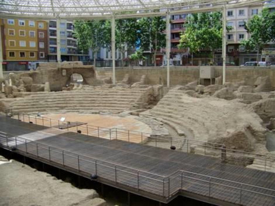
Le théâtre Romain