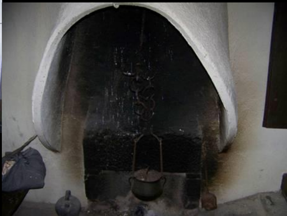
Cheminée traditionnelle des environs de Solsona