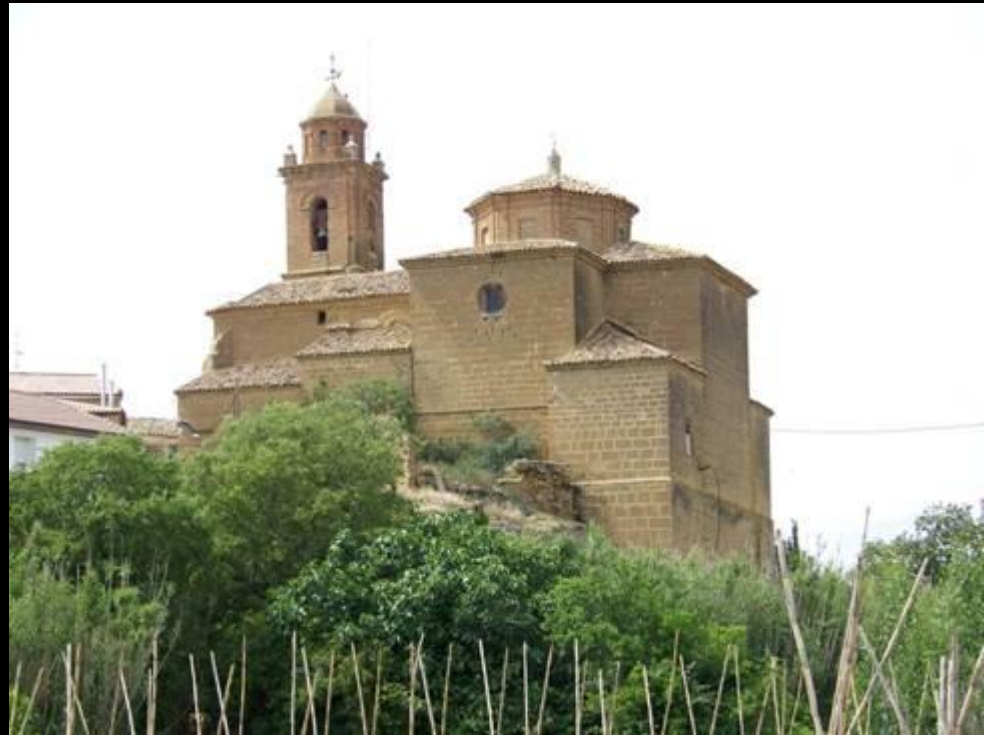
Entre Berbegal et Huesca