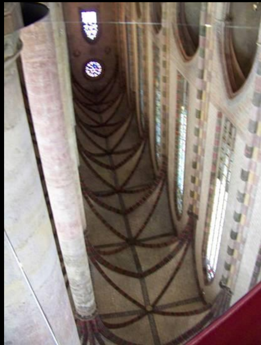
Toulouse, nef du couvent des jacobins vue dans une glace installée autour du pied d'un pilier.