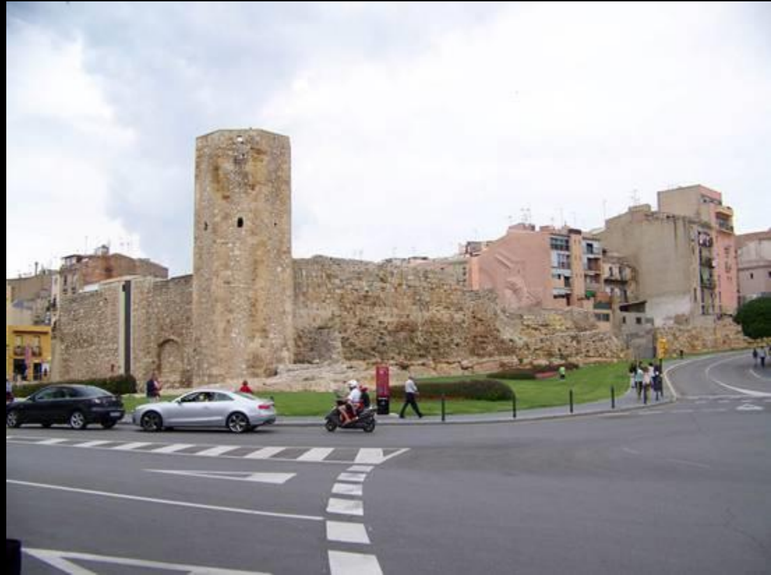
Mur de l'enceinte médiévale de Tarragona