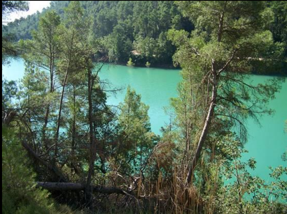
Pantà de Sant Ponç