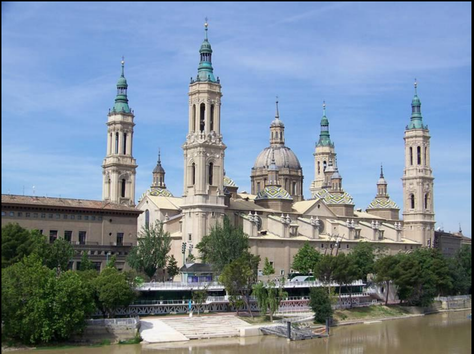
Basílica Nuestra señora del Pilar (Zaragoza)