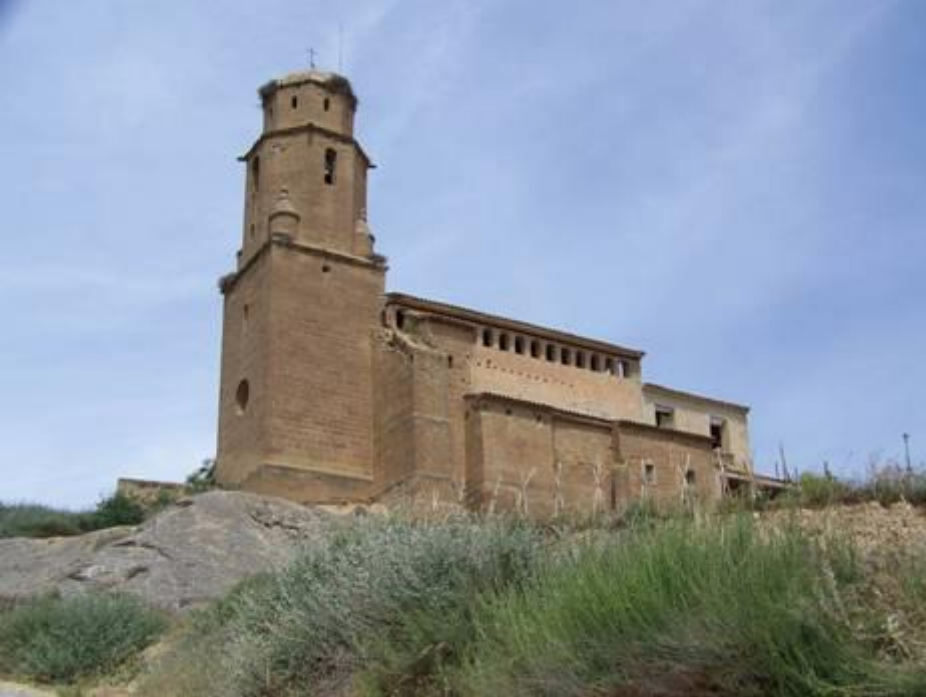
Fornillos entre Barbastro et Berbegal