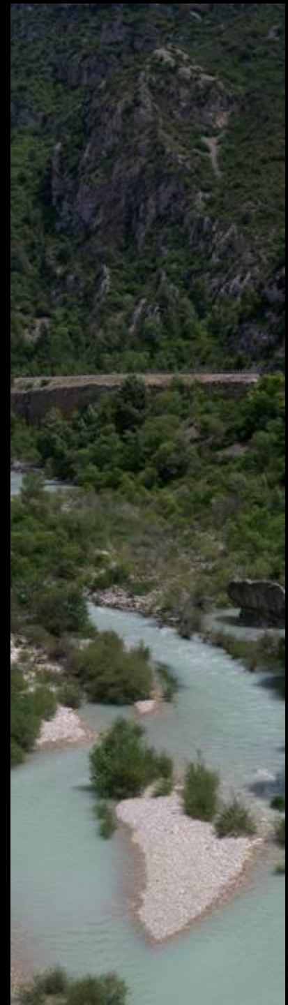
Gorges entre l'Embalse de Barasona et Barbastro