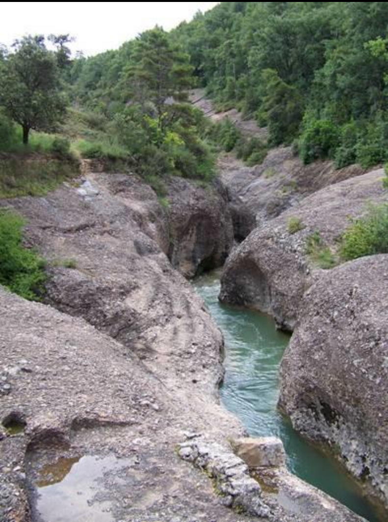
Pont del Clop