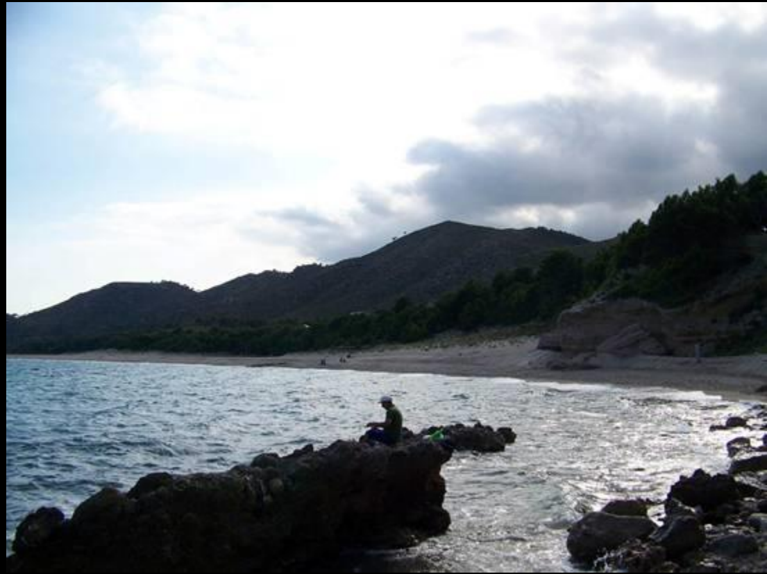
L'Hospitalet de l'Infant