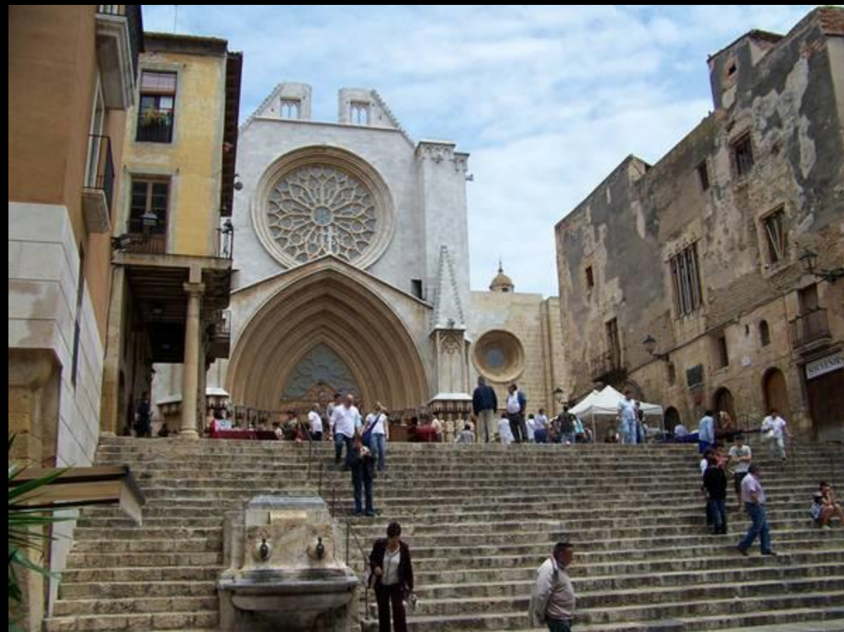
Cathédrale de Tarragona