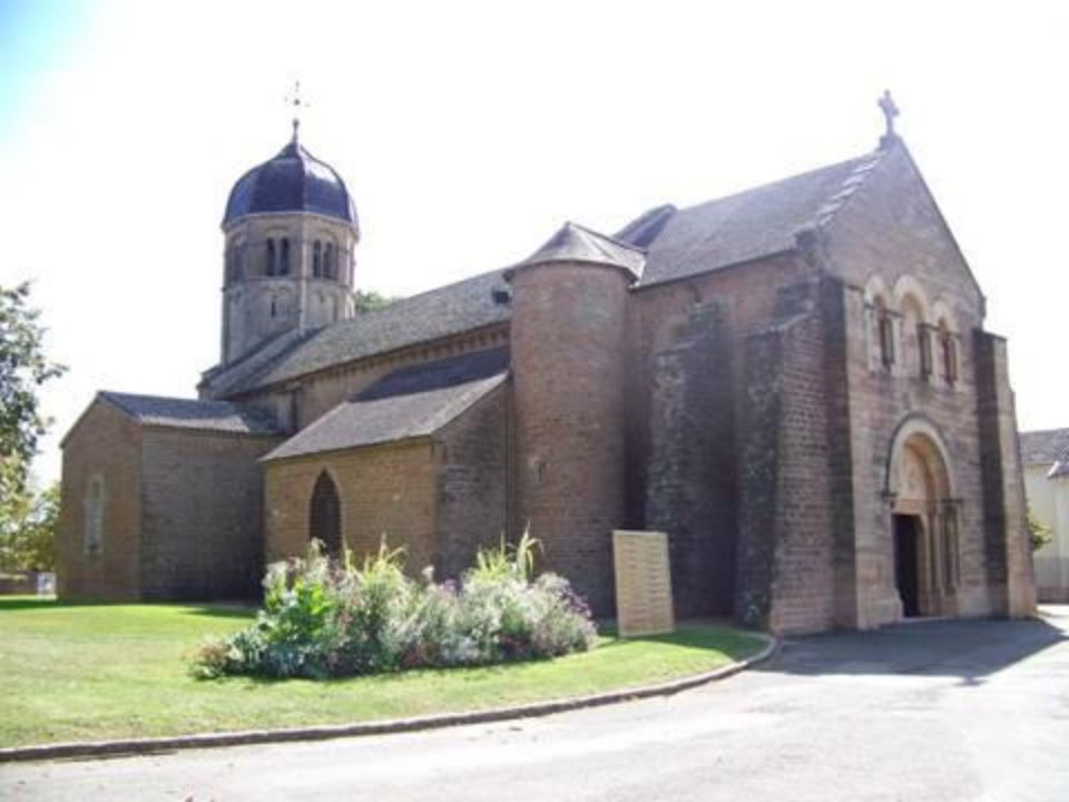
Ste Madeleine Près de Mâcon