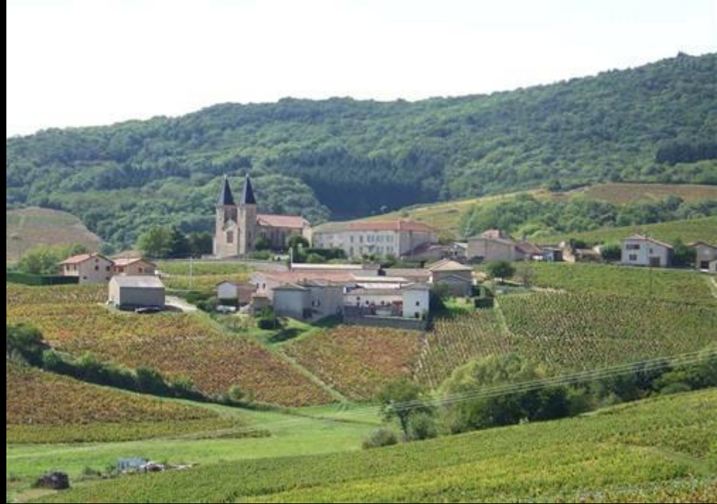
Près de Chiroubles (Beaujolais)