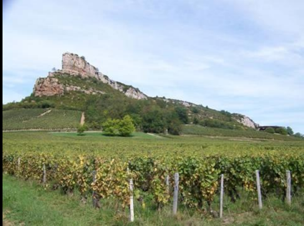
La Roche de Solutré