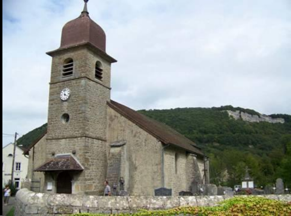
Église de Blois sur Seille