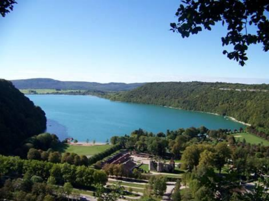
Lac de Chalain