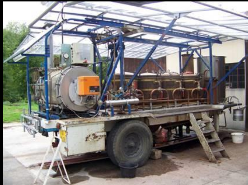
Alambic à Neuvy-sur-Seille