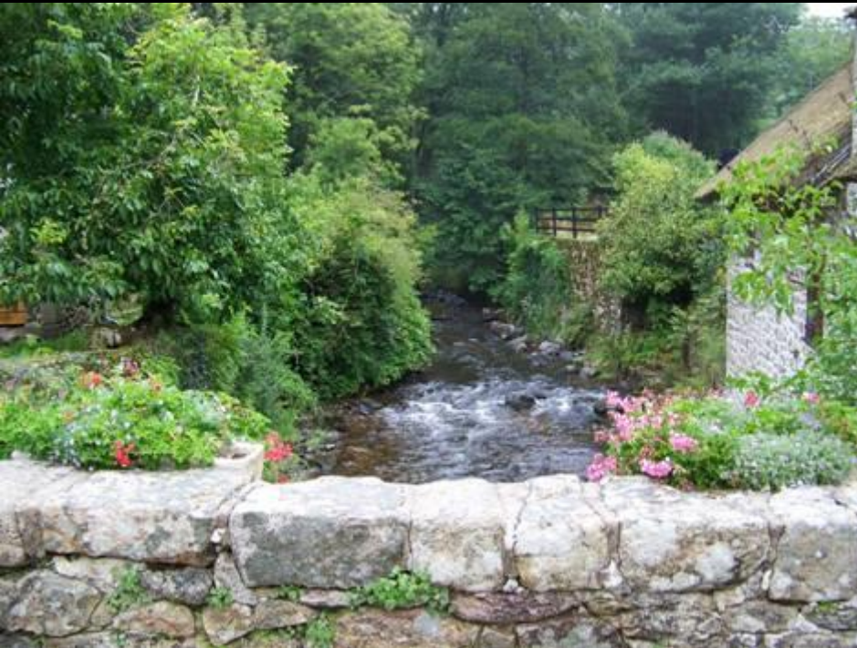
Gimel les cascades (Corrèze)