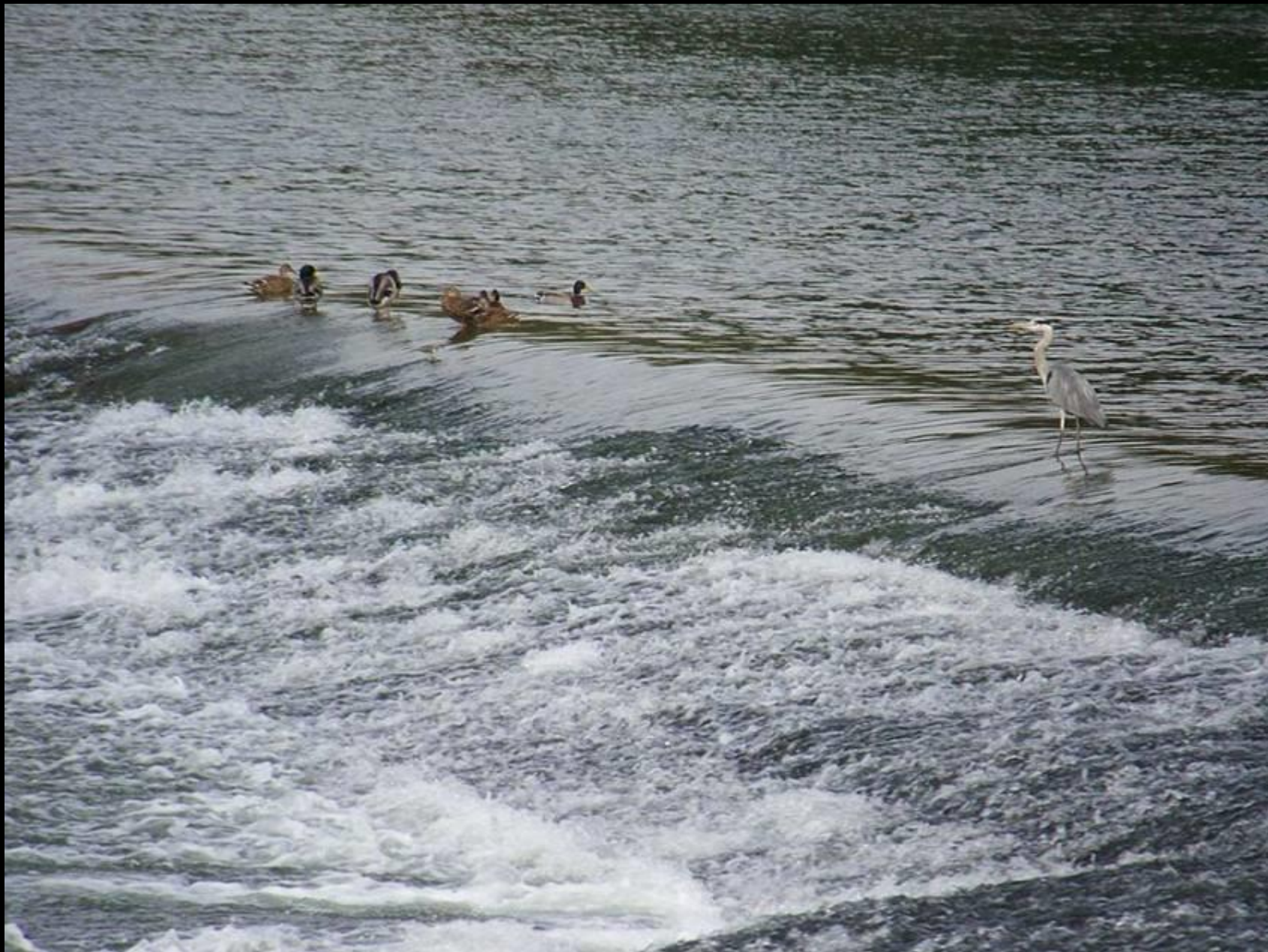
Le Doubs à Dole