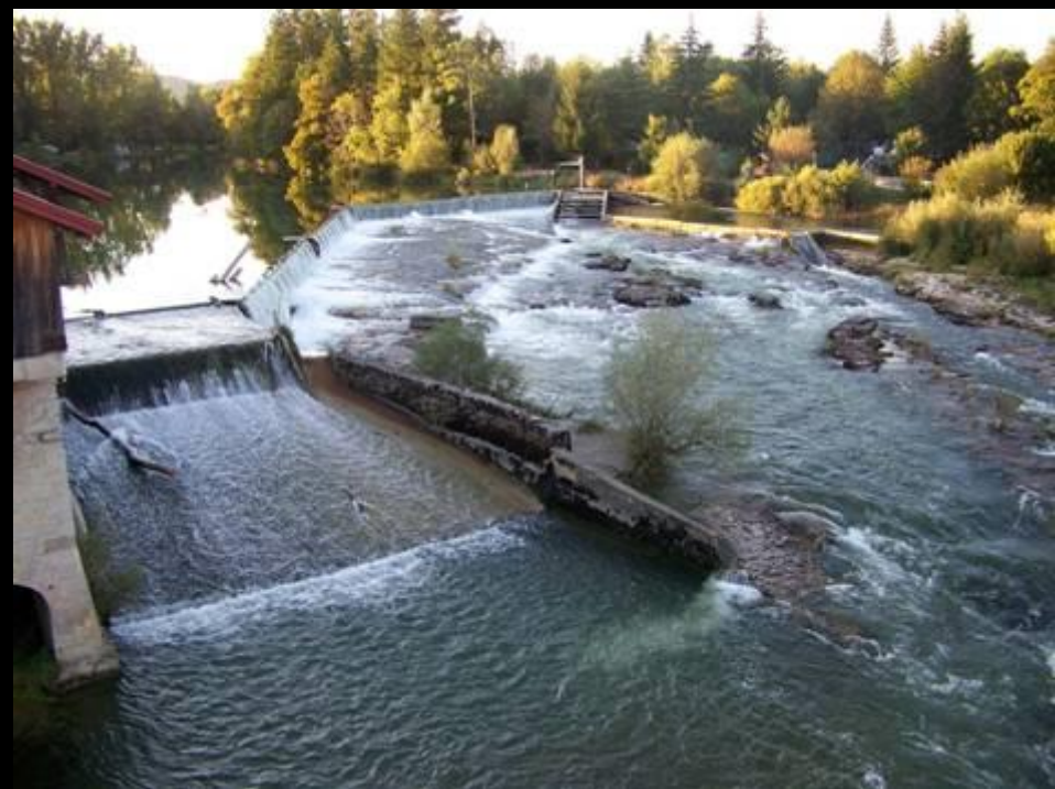
L'Ain au Pont-de-Poitte